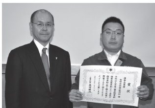
(有)岩井製作所 (金属製品製造業) くぬぎ山 3-16-39