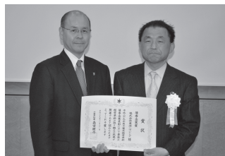
(株)東洋ハウジング (住宅建設業) 新鎌ケ谷 3-2-9